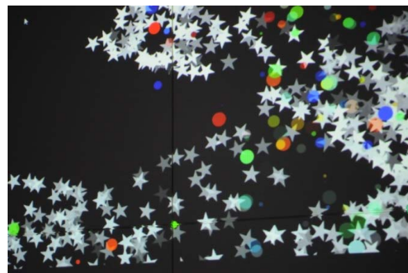
「ヒカリノ Wall painting」