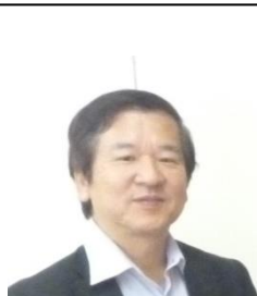
山中研究室 （人材プロファイリング研究）