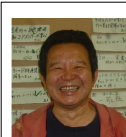
鎌田研究室 （森林再生研究）