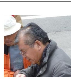
平井研究室 （棚田文化資源活用）