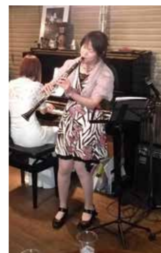
GOTO's BAR (ゴトーズバー)にて