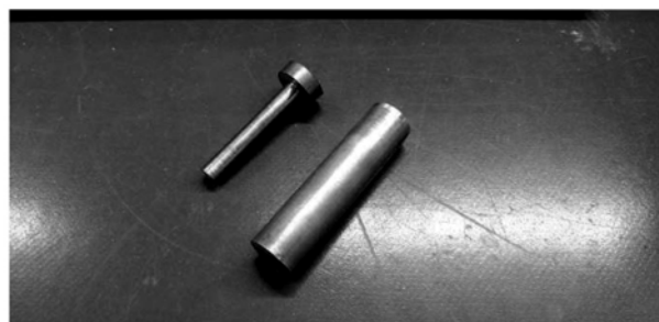
図2 焼き嵌めで製作された部品(左)と削り出し製作前の無垢素材(右)

倍以上、生産加工時間においても4倍程度の違いがあることがわかった。このように、新たな加工方法を使うことにより時間の短縮、原材料の使用量削減を大幅に行うことができることが数値によって示された。実際に製作した部品を図2に示す。