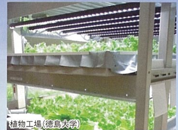
植物工場(徳島大学)